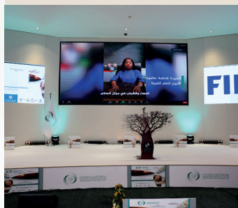
Son Altesse Muhammadu Sanusi II 14 ème Emir de Kano et Ambassadeur des ODD