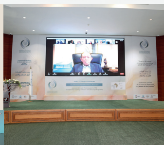
Tun Musa Hitam Ancien Vice-premier ministre de la Malaisie