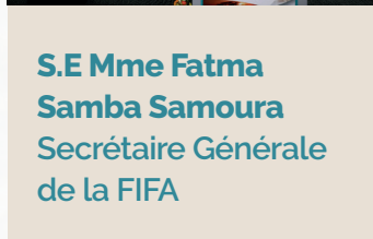
S.E Mme Fatma Samba Samoura Secrétaire Générale de la FIFA