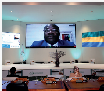
S.E Mme Aisha Muhammadu Buhari Première Dame du Nigeria

Il s'agit de hautes personnalités dont les actions et le parcours pour la paix représentent une source d'inspiration et en font des modèles de leadership pour la paix pour nos jeunes leaders. Pour l'année 2021, voici des leaders inspireurs qui ont bien voulu délivrer des messages de paix ou avoir un échange intergénérationnel avec les jeunes ambassadeurs de la paix :